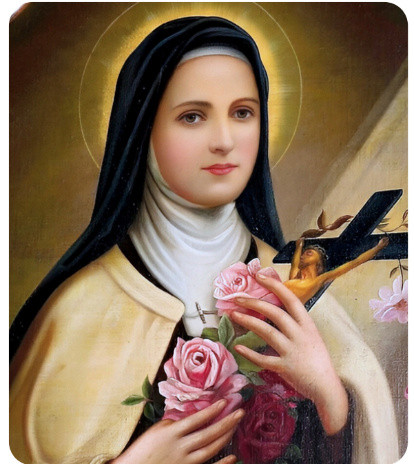
Santa Teresita de Lisieux

Santa Teresita de Lisieux, “la Pequeña Flor”, comprendió profundamente el corazón dulce y humilde de Jesús. Al contemplar cómo ser transformada por el amor de Cristo, reflexionó que “Lo que le agrada [a Jesús] es verme amar mi pequeñez y mi pobreza, es la esperanza ciega que tengo en su misericordia... cuanto más débil se es, sin deseos ni virtudes, más cerca se está de las operaciones de ese Amor consumidor y transformante” (Carta 197 a Sor María del Sagrado Corazón, 17 de septiembre de 1896). Unámonos a Santa Teresita en la oración para que nuestros corazones sean humildes como Jesús.