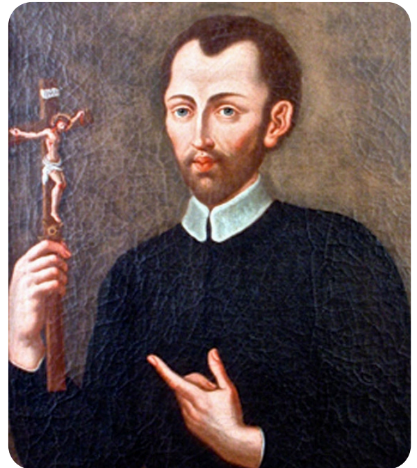
San Alfonso María de Liguorio

Al considerar el Sagrado Corazón de Jesús y el gran amor de Cristo por la humanidad, reflexionamos sobre cómo hemos fallado en alcanzar su amor y la necesidad de expiar nuestros pecados. También aprovechamos este momento para arrepentirnos como nación por los pecados del pasado de nuestro país. Oremos por el perdón y la sanación de los daños causados por los pecados originales de la esclavitud y el racismo de nuestra nación. Un elemento central de la devoción al Sagrado Corazón es la reparación – la práctica de enmendar los errores que hemos cometido, pidiendo a Cristo que perdone nuestros pecados y convierta nuestros corazones para amar como Él ama. Oremos con San Alfonso María de Liguorio, fundador de los Redentoristas, mientras expiamos nuestros pecados y nos consagramos al corazón de Jesús: