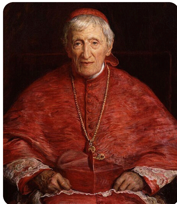
San John Henry Newman por Sir John Everett Millais

San John Henry Newman tomó el lema episcopal Cor ad cor loquitur (“El corazón habla al corazón”), entendiendo que el Señor nos salva hablando a nuestro corazón desde su Sagrado Corazón. Fue en la Sagrada Eucaristía, la mayor forma de alabanza a Dios, donde San John Henry Newman cultivó su encuentro más profundo con el corazón vivo de Jesús. Oremos con San John Henry Newman para que podamos escuchar al Sagrado Corazón que nos habla cuando alabamos y adoramos a Jesús en la Eucaristía.